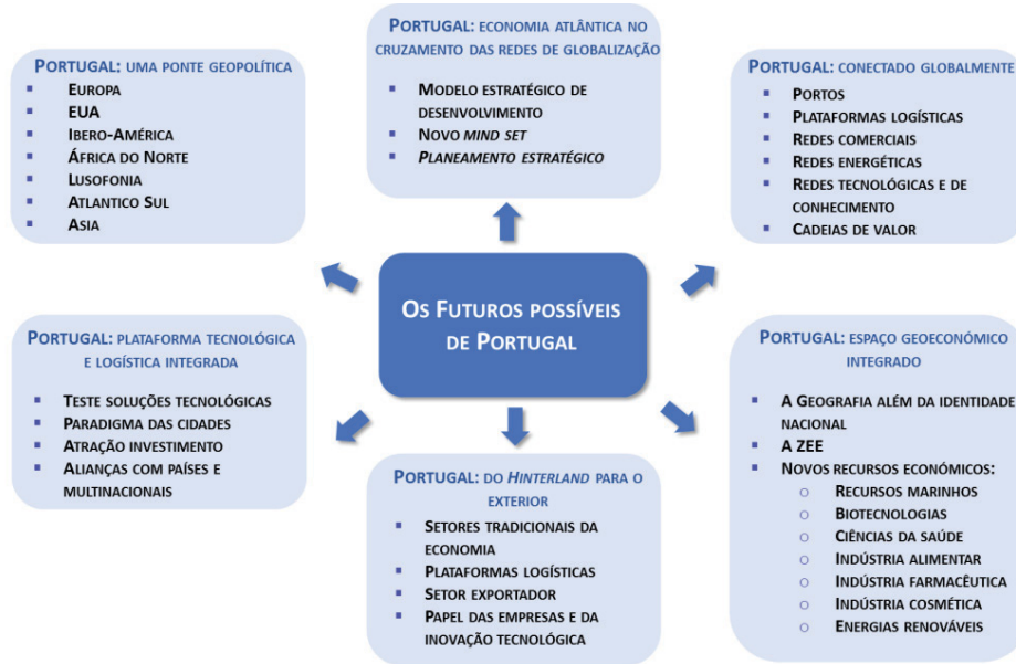
Figura 2 — Futuros possíveis de Portugal